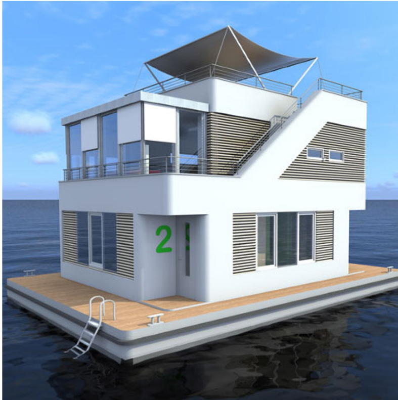
Visualisierung FH 95