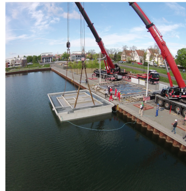
Kranung 80 to